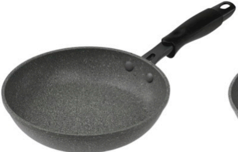
フライパン 20cm (高さ 4.5 cm) フライパン 22cm (高さ 5.0 cm)