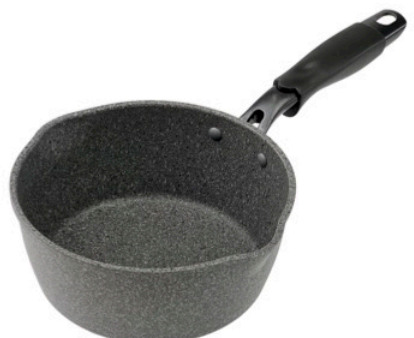
ソースパン 16cm (高さ 7.0 cm) ソースパン 18cm (高さ 8.0 cm)