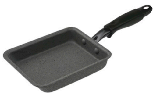
玉子焼 18*13 cm (高さ 3.2 cm)