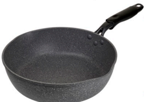
ディープパン 26cm (高さ 8.0 cm) ディープパン 28cm (高さ 8.0 cm)

材料の種類/本体：アルミニウム合金 はり底：ステンレス鋼（クロム 16%） （底の厚さ：2.5 mm（はり底部を含む）） 表面加工/内面：ふっ素樹脂塗膜加工 外面：耐熱焼付塗装（底面を除く） その他の材料/ハンドル：フェノール樹脂