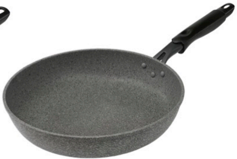
フライパン 26cm (高さ 5.8 cm) フライパン 28cm (高さ 6.0 cm)